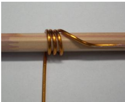
写真 1（木の棒に巻きつける）