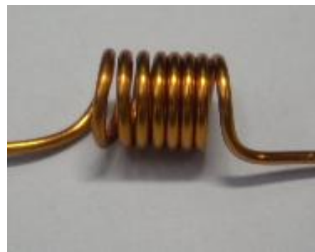
写真 2（完成したコイル）