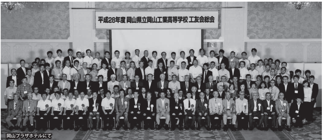
岡山プラザホテルにて

をいただき、平成二十九年度の総会へ向けて協議しました。一番の問題点は、減少している参加者の増加を図ることでした。地道ではありますが、各支部を通して、一人ひとりへの声かけ活動を積極的に進めていくこと、案内を発送する方々を増やすなどになりました。今年の平成二十九年度工友会総会は、平成二十九年七月十五日(土)です。本校のホームページの「卒業生の皆様へ(工友会)」などで情報を見ていただきたいと思います。より多くの参加者となればと思っておりますので、皆様の声かけなどのご協力をいただけると助かります。最後になりましたが、皆様の益々のご健勝とご活躍、そして、工友会ならびに母校の発展を祈念いたします。